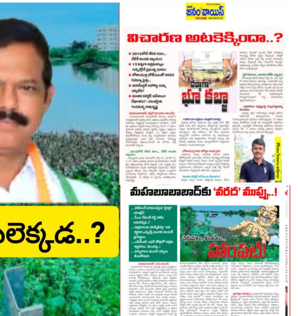
ఉన్నాయి. పక్కా ఆధారాలు ఉన్నప్పటికీ ప్రస్తుత పాలకులు, అధికారులు ఎందుకు చర్యలు తీసుకోవడం లేదని ప్రశ్నిస్తున్నారు.